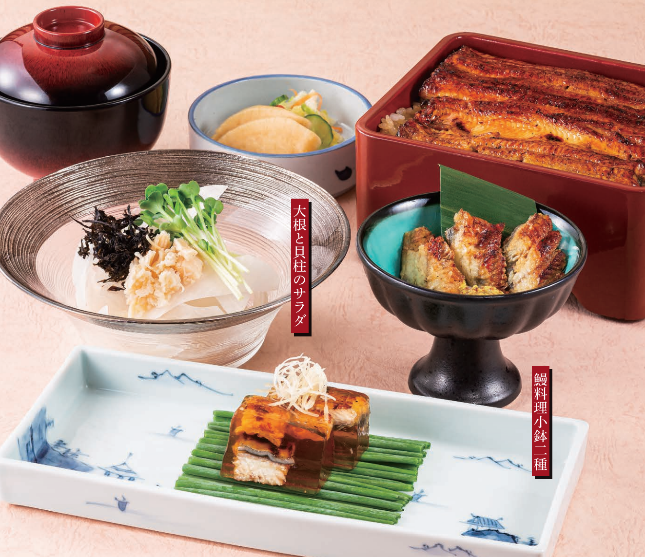
大根と貝柱のサラダ