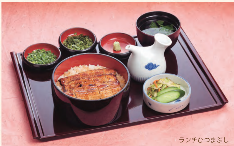
ランチひつまぶし